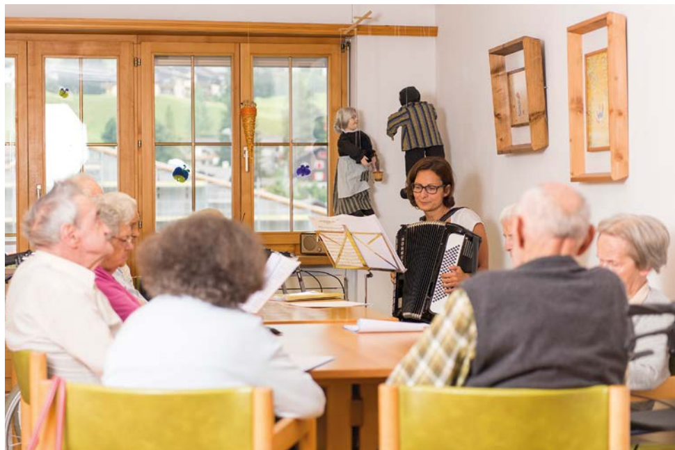
Altersheime Schiers, Jenaz und Klosters

Die Heime Schiers, Jenaz und Klosters sind alle nur wenige Gehminuten vom Dorfzentrum entfernt. Die grosszügigen Aufenthaltsbereiche, Terrassen oder Grünanlagen laden zum verweilen ein.